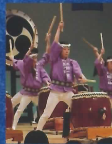
NPO 法人 太鼓の楽校