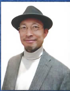
北方 喜旺丈 (作曲家・ピアニスト)